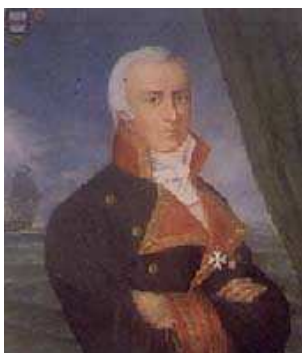
Le Vice-roi Liniers y Bremond

Commémoration du bicentenaire de la « Defensa » de Buenos-Aires par le Général de Liniers y Bremond