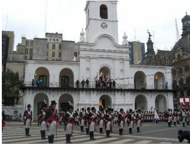
Vue du Régiment

Une reconstitution historique de la Reconquista a eu lieu en public le 12 août 2006 à Buenos-Aires, avec la participation d'acteurs et de nombreux figurants.