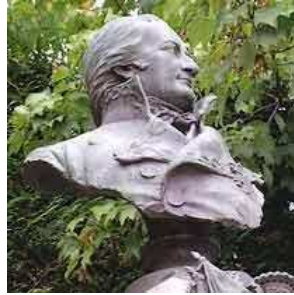
Buste Liniers, à Niort

Commémoration du bicentenaire de la mort du Général de Liniers y Bremond Comte de Buenos –Ayres Vice-roi de la Plata