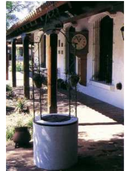
Musée de la Reconquista (Tigre)

Région de Tigre (anciennement Santa Maria de las Conchas)