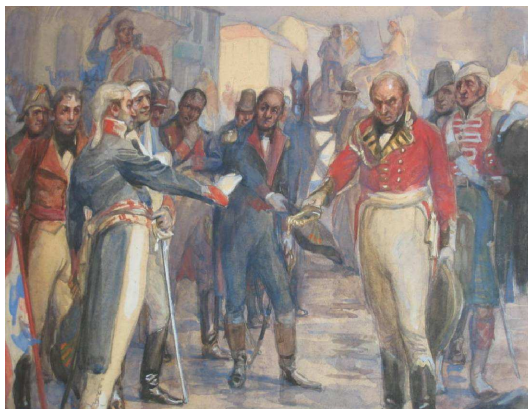
« Le sabre de Beresford »

Commémoration du bicentenaire de la « Reconquista » de Buenos-Aires par le Général de Liniers y Bremond