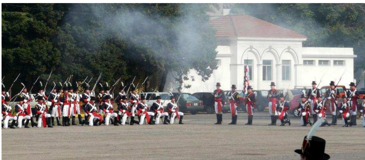
Salves pour le baptême du feu