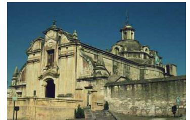
Propriété du Vice Roi (Alta Gracia)