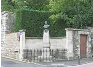
Stèle avec buste de Jacques de Liniers – Niort