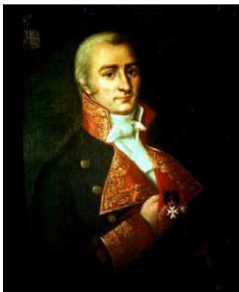
Santiago de Liniers y Bremond (1753-1810)

Commémoration du bicentenaire de la « Defensa » par le General de Liniers y Bremond