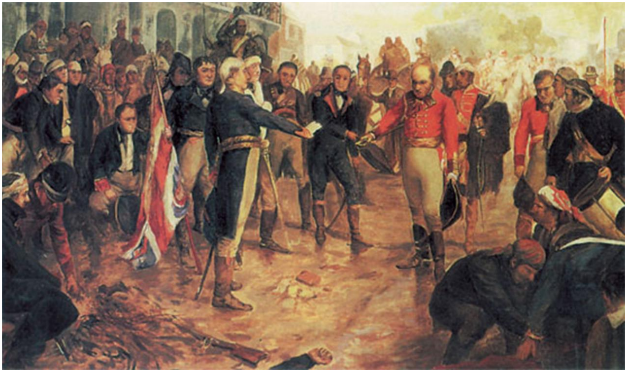
Charles Fouqueray – La Reconquista de Buenos-Aires – 1908 Cabildo de B-A

Sans la contribution exceptionnelle de Jacques/Santiago de Liniers, le destin de la Vice-royauté du Río de la Plata aurait été tout autre. À mon sens, l'extraordinaire réalité que nous offrent des pays tels que l'Argentine, l'Uruguay et le Paraguay en sont la meilleure illustration. Des pays américains d'influence espagnole mêlée aux racines européennes de nombreux émigrants, certains des héros, d'autres des inconnus qui en ont fait une deuxième Europe dans un autre continent.