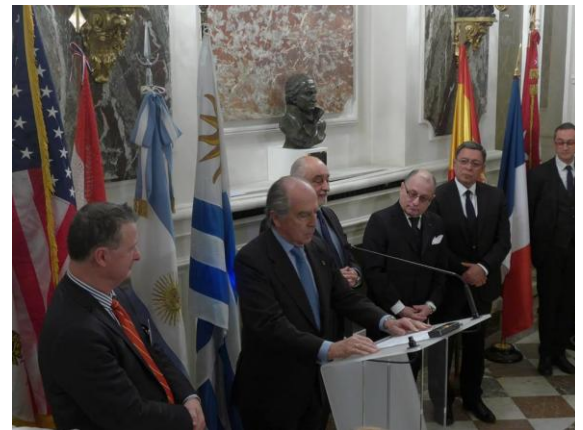
SE M. Ramón de Miguel, ambassadeur d'Espagne en compagnie des ambassadeurs d'Uruguay, du Paraguay et de Bolivie