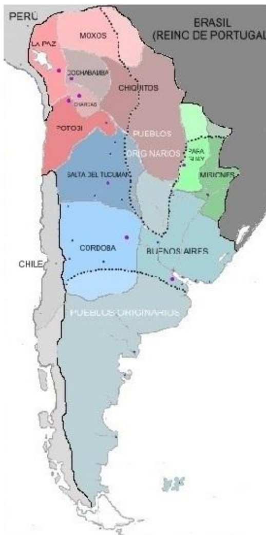
L'ancienne vice-royauté du Rio de la Plata

L'Argentine, l'Uruguay, le Paraguay et l'Espagne partagent une expérience historique commune, une culture, une langue et des valeurs qui nous rapprochent. Nous sommes des pays frères et je suis toujours ému que l'Espagne soit désignée comme la « mère patrie » dans l'ancienne vice-royauté du Rio de la Plata .