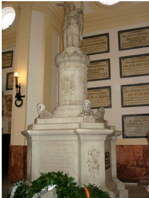
Tombe de Jacques de Liniers dans les Panthéon des Marins Illustres à Cadix