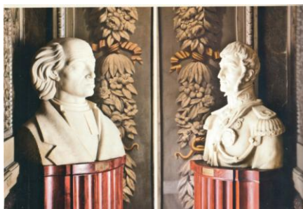
Miguel Hidalgo José de San Martín