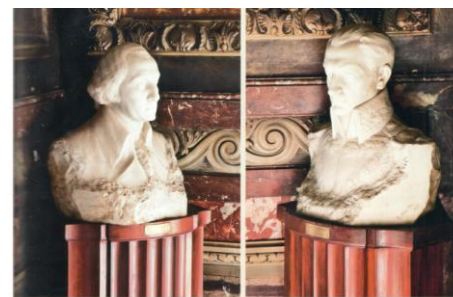
...Georges Washington Simon Bolivar

Jacques de Liniers siègera désormais dans cette maison, non loin de Miguel Hidalgo y Costilla, (Mexique) Jose de San Martin (Argentine) , George Washington, (Etats Unis d'Amérique) , Simon Bolivar (Venezuela).