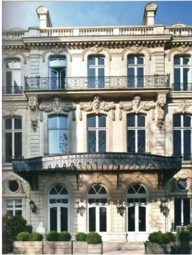
Hôtel Le Marois

Jacques de Liniers a sa place ici, dans le salon d'entrée de l'Hôtel le Marois. Par son engagement et sa vie, il a contribué à un grand pan de l'histoire des Amériques, du Nord comme du Sud.