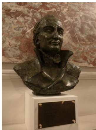
Jacques de Liniers