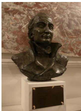
Jacques de Liniers